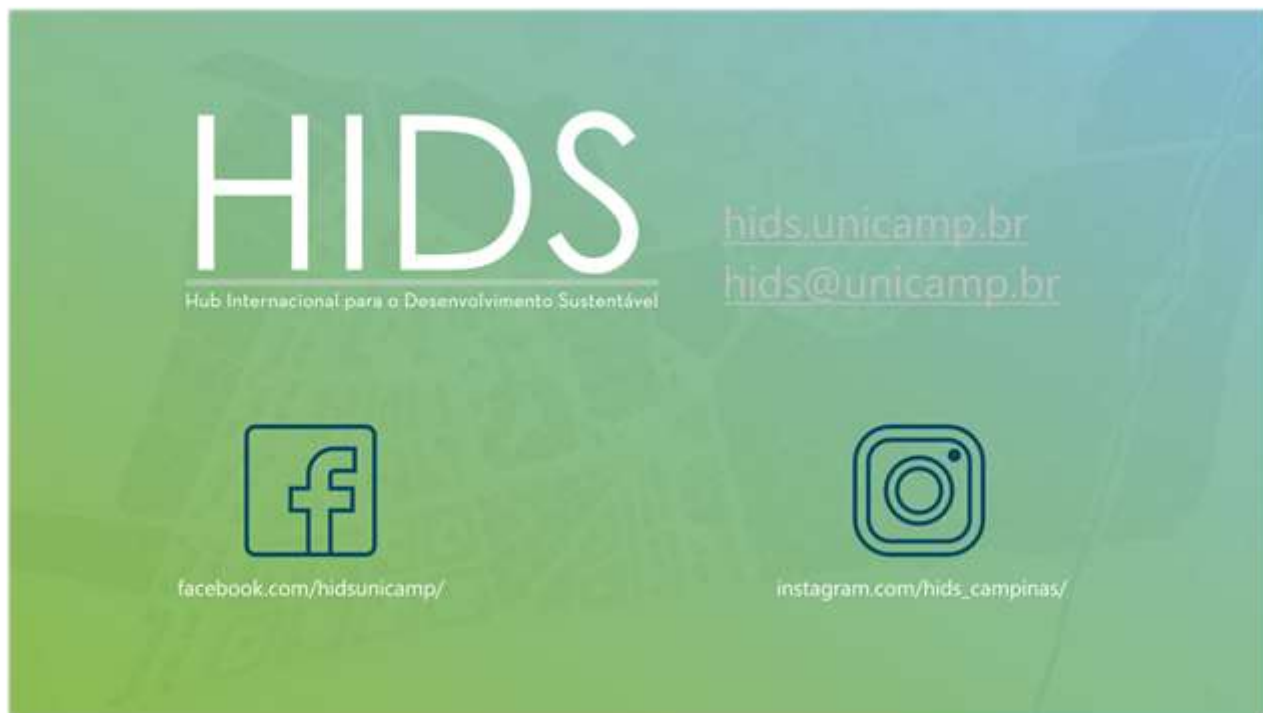
Figura 19: Slide 19