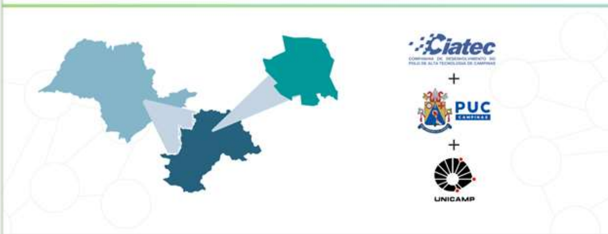
Figura 4: Slide 4

HIDS High Innovation District & Entrepreneurship System