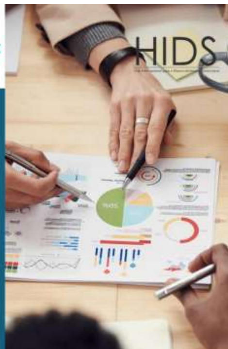
Figura 9: Slide 9