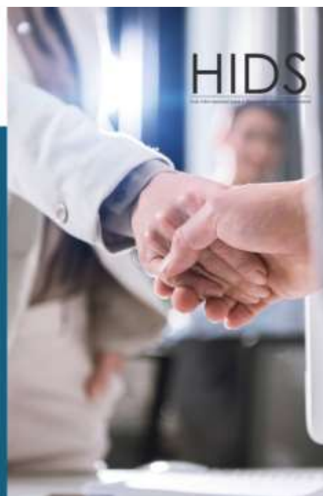
Figura 10: Slide 10