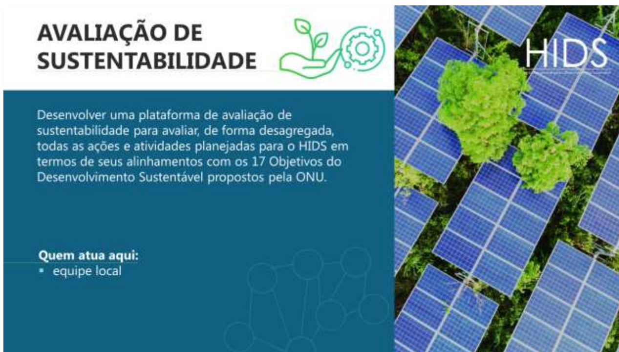
Figura 11: Slide 11