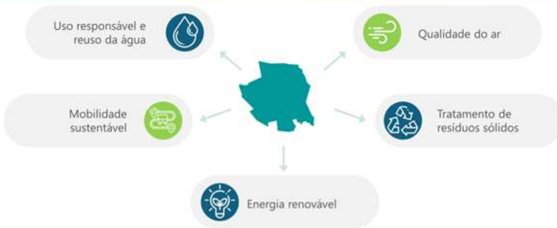
Figura 17: Slide 17

HIDS Instituto de Planejamento e Desenvolvimento Urbano