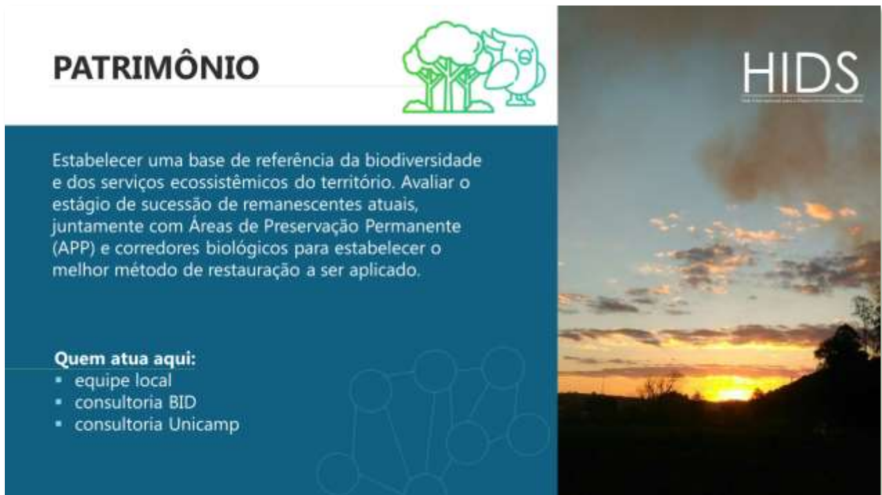
Figura 7: Slide 7