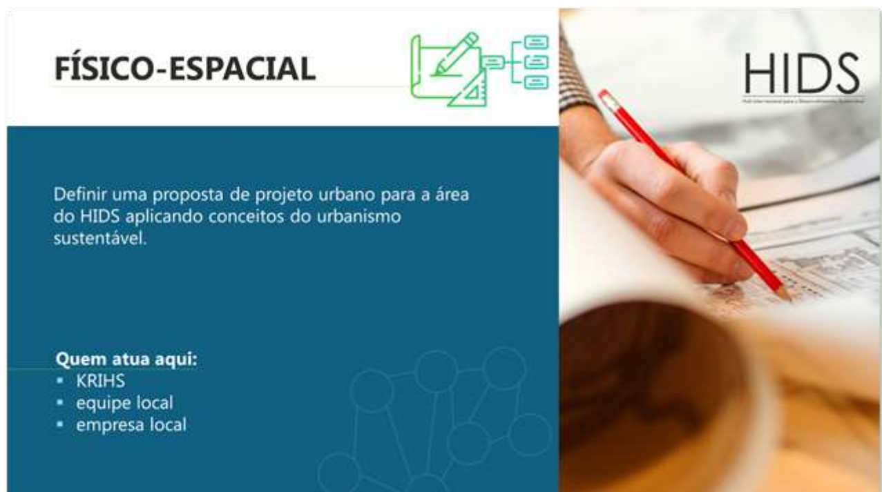
Figura 8: Slide 8