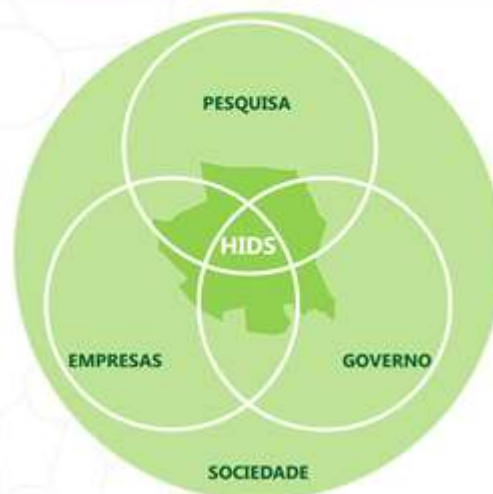
Figura 3: Slide 3

Deve ser um território propício para pesquisa aplicada e direcionada aos temas do desenvolvimento sustentável , com gestão da sustentabilidade, parcerias e conexões para formação de uma rede de colaboração nacional e internacional .