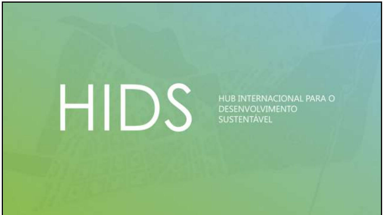
Figura 1: Slide 1