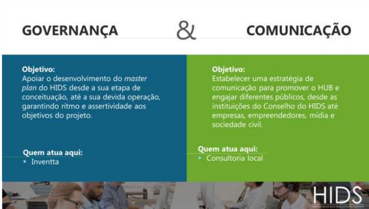
Figura 12: Slide 12